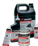
Lubrificanti Una gamma completa è disponibile nel nostro catalogo accessori.