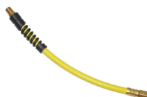
33204 91486357 Tubo a frusta da 3/8" NPT, diametro interno 10 mm, lunghezza 30 cm