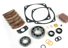
2145-TK2 47100011 Kit motore