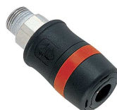
Prese istantanee Una gamma completa è disponibile nel nostro catalogo accessori.