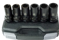
SK6M6L 81287401 Kit busole 3/4", 6 pezzi (24, 27, 30, 32, 33 e 36 mm)