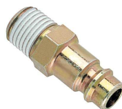
IB8NMC3 88103304 Innesto Series IBN/IBS, filettatura maschio 3/8", foro 8 mm (ISO6150B / MIL-C4109)