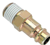
77NMC3 88104088 Innesto Series 7N7/7S7, filettatura maschio 3/8", foro 7,2 mm (EURO 7,2 - 7,4)