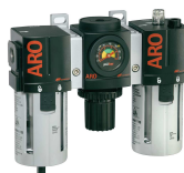
Filtri, regolatori, lubrificatori Una gamma completa è disponibile nel nostro catalogo accessori.