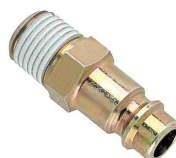
IB6NMC3 88103023 Innesto Series IBN/IBS, filettatura maschio 3/8", foro 6 mm (ISO6150B / MIL-C4109)